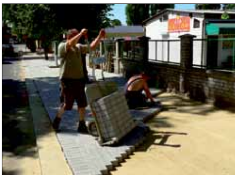
Deptak przy targowisku w trakcie budowy (Pleszew)