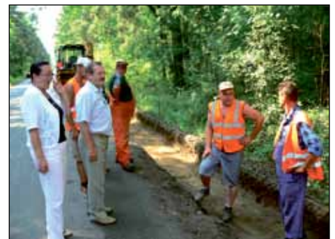
Wizyta starosty u drogowców, (Pieruchy)