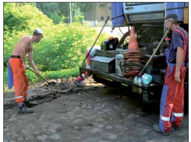
Budowa drogi w Karminie