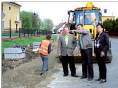
Budowa chodnika przy kościele w Kowalewie